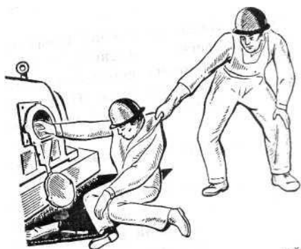
Рис. 3. Освобождение пострадавшего от действия от токоведущей части, находящейся под электрического тока