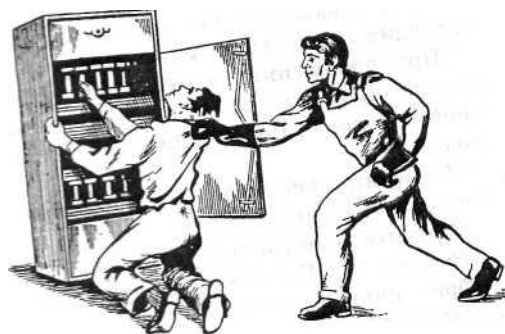
Рис. 4. Освобождение пострадавшего напряжением до 1000 В

При поражении электрическим током необходимо быстро освободить пострадавшего от действия тока - немедленно отключить ту часть электроустановки, которой касается пострадавший (рис. 1). Когда невозможно отключить электроустановку, следует принять иные меры по освобождению пострадавшего, соблюдая надлежащую предосторожность.