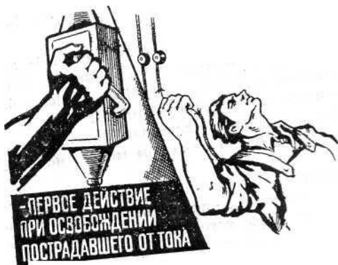
Рис. 1. Освобождение пострадавшего от действия электротока путем отключения электроустановки тока в электроустановках